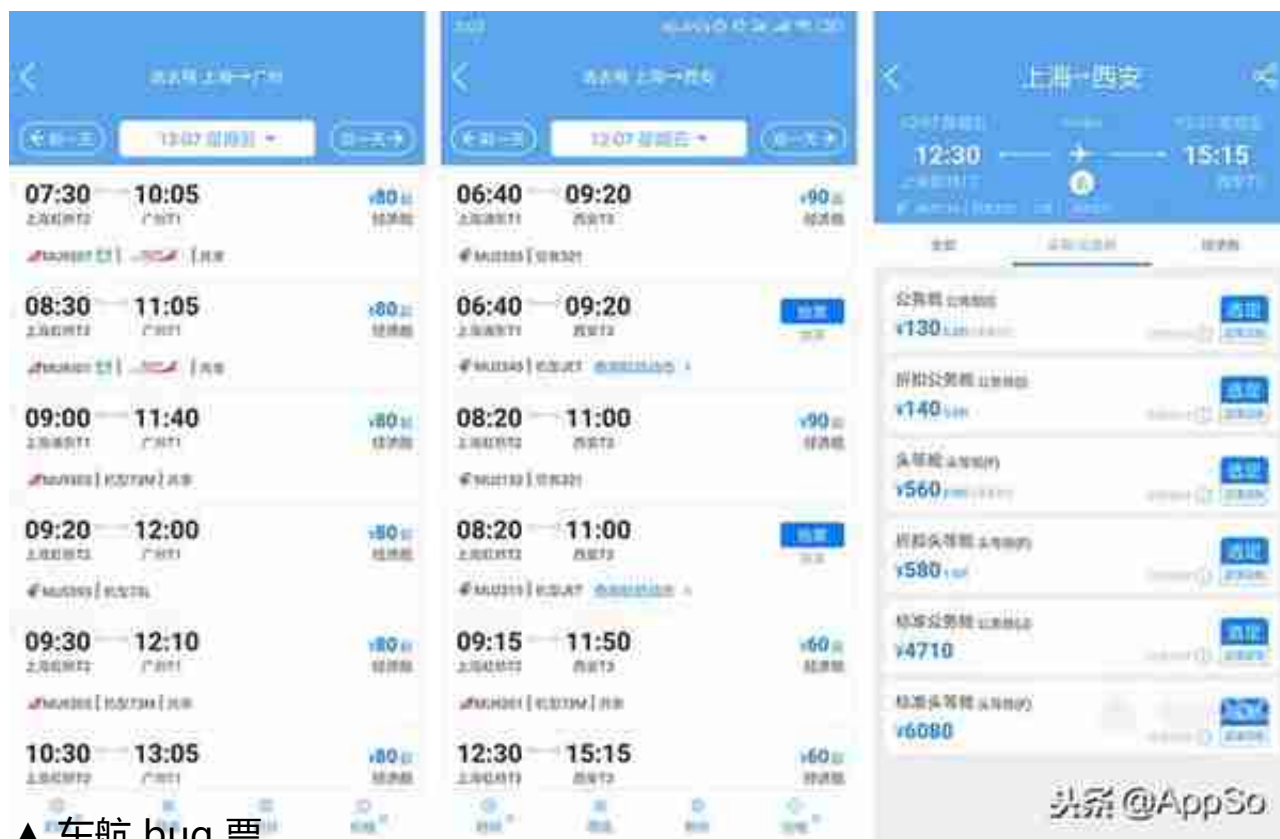
▲ 东航 bug 票

和麦当劳、支付宝的积分可以兑换奖品一样，机票也可以用里程兑换。里程票的好处在于我们有了近乎随时说走就走的条件，即使是在票价贵上天的春运旺季，如果你是航司高级别的会员，也有可能申请到里程票。