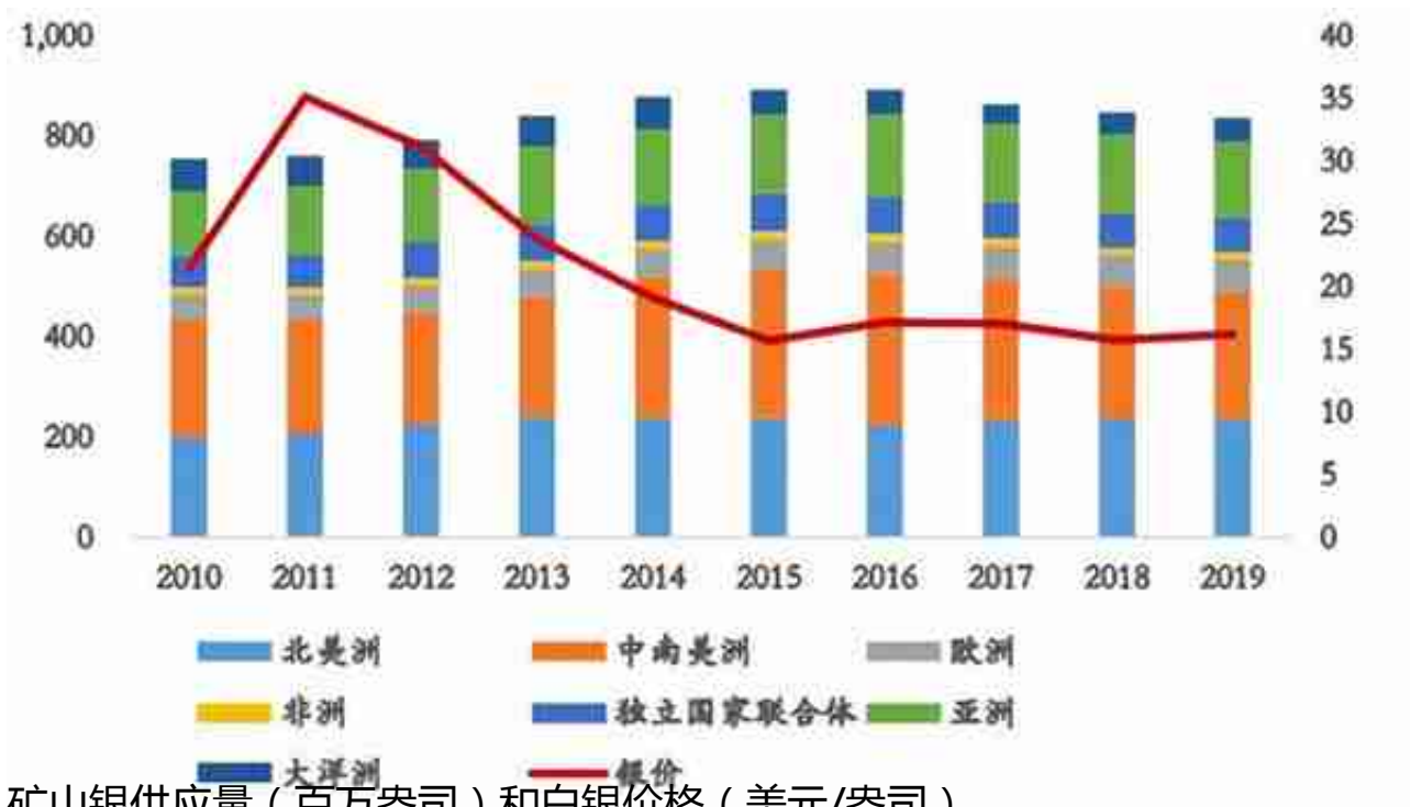
矿山银供应量（百万盎司）和白银价格（美元/盎司）

目光转向需求。首先，据白银研究所给出的预测数据，今年全球白银总需求将同比增长8%，达到11.12亿盎司，有望刷新历史新高。三个领域对银有着需求，工业领域、消费领域和投资领域。每个领域的占比大约是60%、20%、20%。