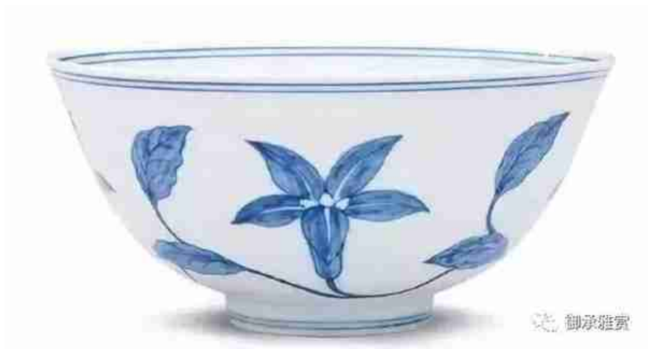
明成化青花缠枝秋葵纹官盃