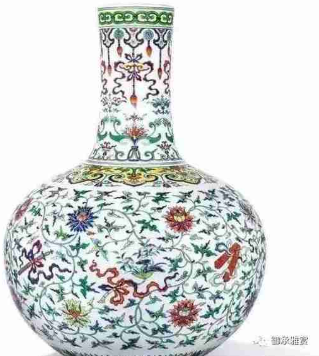
清乾隆斗彩加粉彩暗八仙缠枝莲纹天球瓶

此件拍品曾被诸名家所珍爱，以传奇之势流转传承。最早由俄罗斯Rudolf Sterz所藏，后由其家族递藏，此后于1984年在纽约苏富比上拍，之后被张宗宪先生收入麾下，后由台湾鸿禧美术馆收藏，于2005年在香港苏富比上拍，终被北美十面灵璧山居以4492万港元所藏。