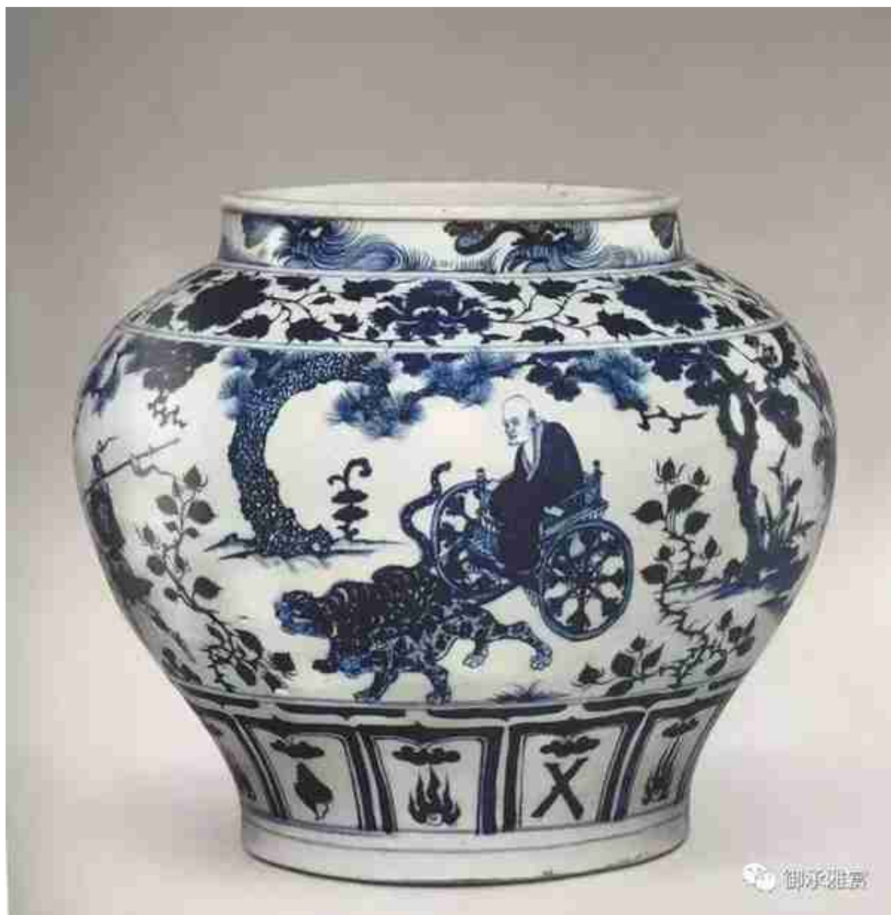
元青花鬼谷子下山图罐