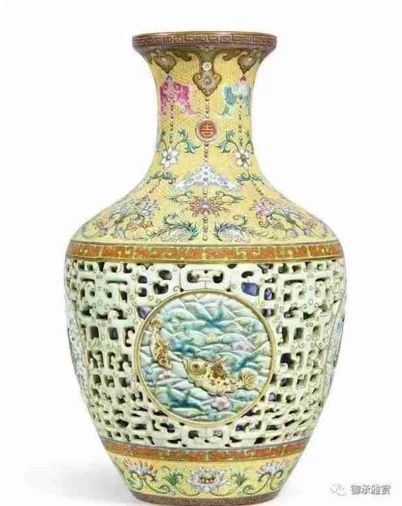
清乾隆粉彩镂空转心瓶