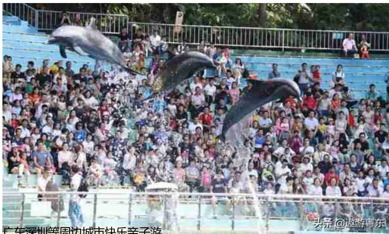
广东深圳等周边城市快乐亲子游

海豚作为全球各大水族馆的大明星，颜值高、性格好、技术棒，单是那流畅的身形，光滑的皮肤，小巧的嘴巴，漂亮的尾鳍就很吸引人