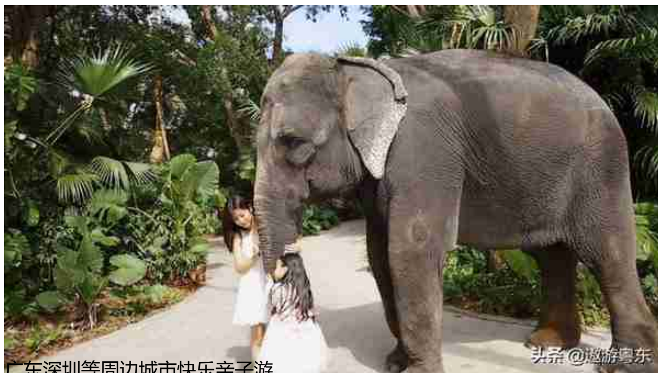
广东深圳等周边城市快乐亲子游