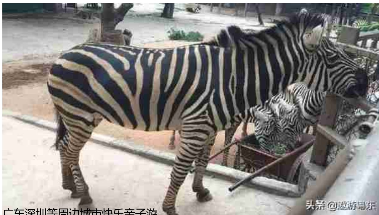
广东深圳等周边城市快乐亲子游

在这里，小朋友可以跟很多小动物近距离接触，不仅能让他们亲近大自然 还可以学会跟动物友好相处