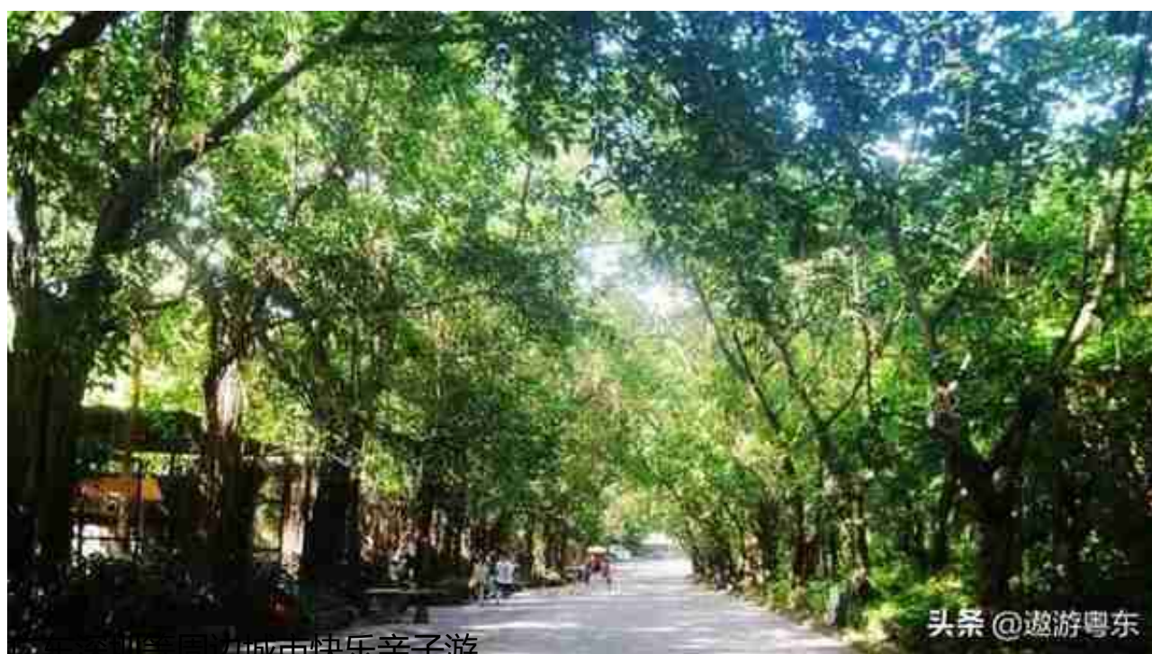
广东深圳等周边城市快乐亲子游

在这里，小朋友可以跟很多小动物近距离接触，不仅能让他们亲近大自然 还可以学会跟动物友好相处