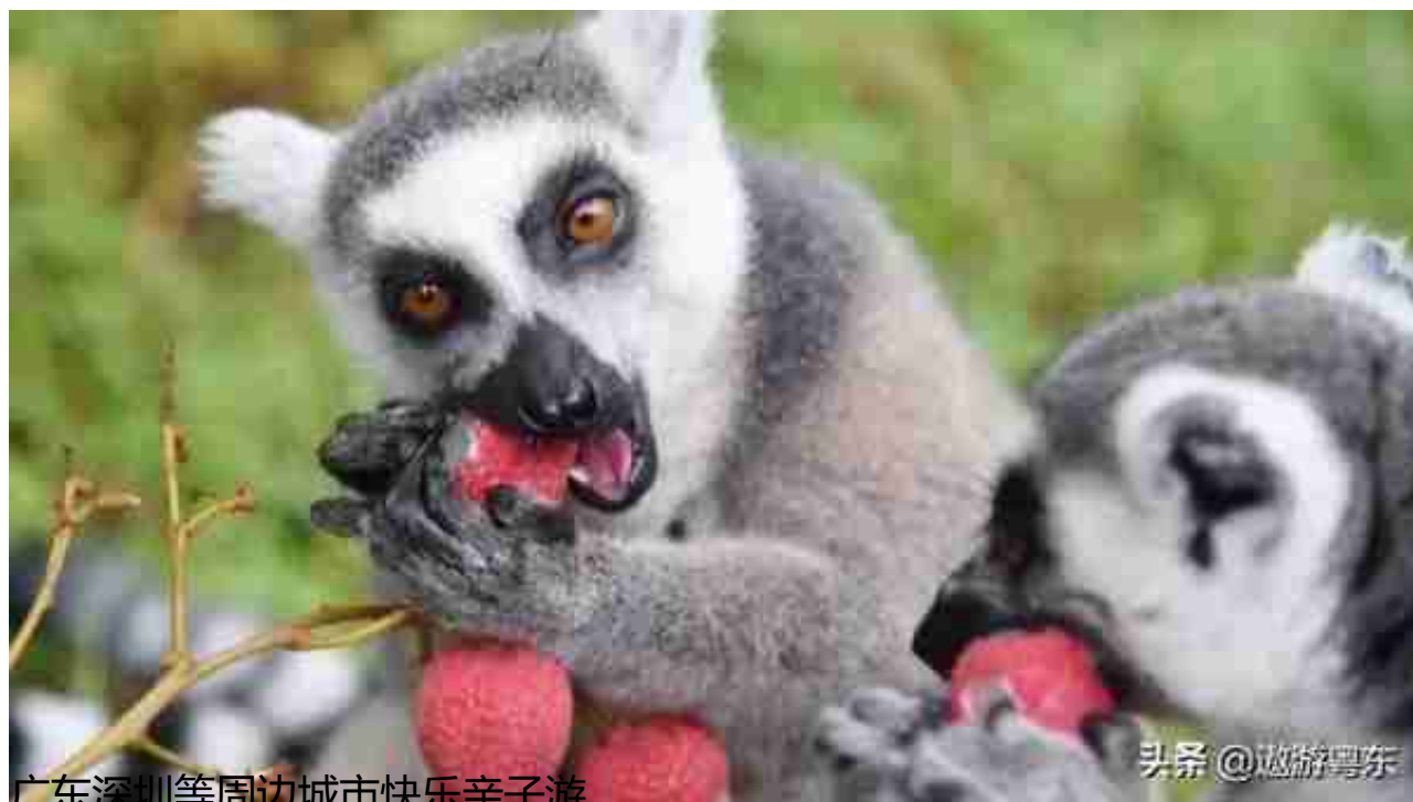
广东深圳等周边城市快乐亲子游

耳廓狐，最小的犬科动物之一，大大的耳朵，小小的身体，形成视觉上的反差萌 它们是夜行动物。白天眯着迷离睡眼，慵懒可爱，晚上是活跃的小精灵