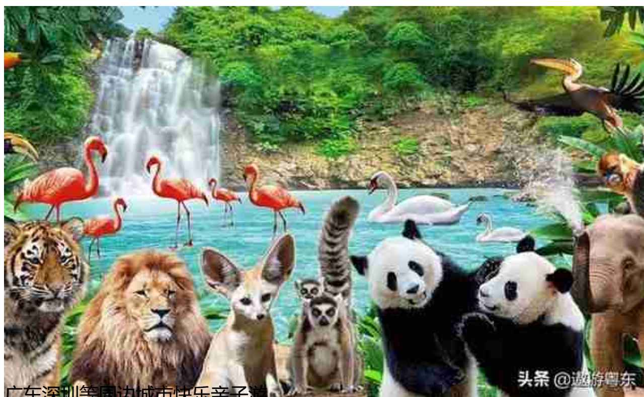
广东深圳等周边城市快乐亲子游

暑假的小尾巴已悄然而至，相信很多小朋友都恋恋不舍这种肆无忌惮的时光，嘿嘿，还有许多家长想在开学前，带孩子出行游玩一圈，为暑假画上一个圆满的句号，那么，这时候，有一个地方相信大家认识的，那就是深圳野生动物园！！最近万众期待的深圳野生动物园特惠票来啦！大小朋友冲冲冲~~不可错过！