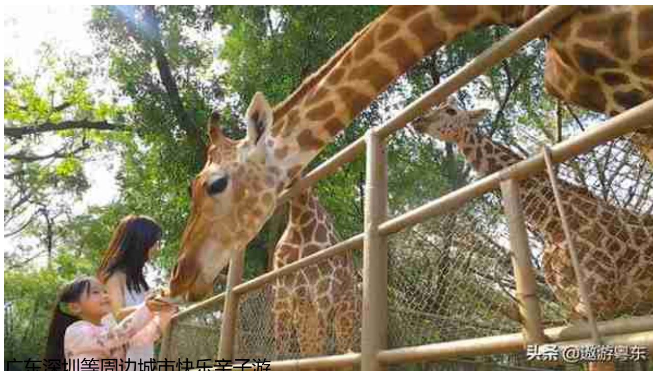
广东深圳等周边城市快乐亲子游