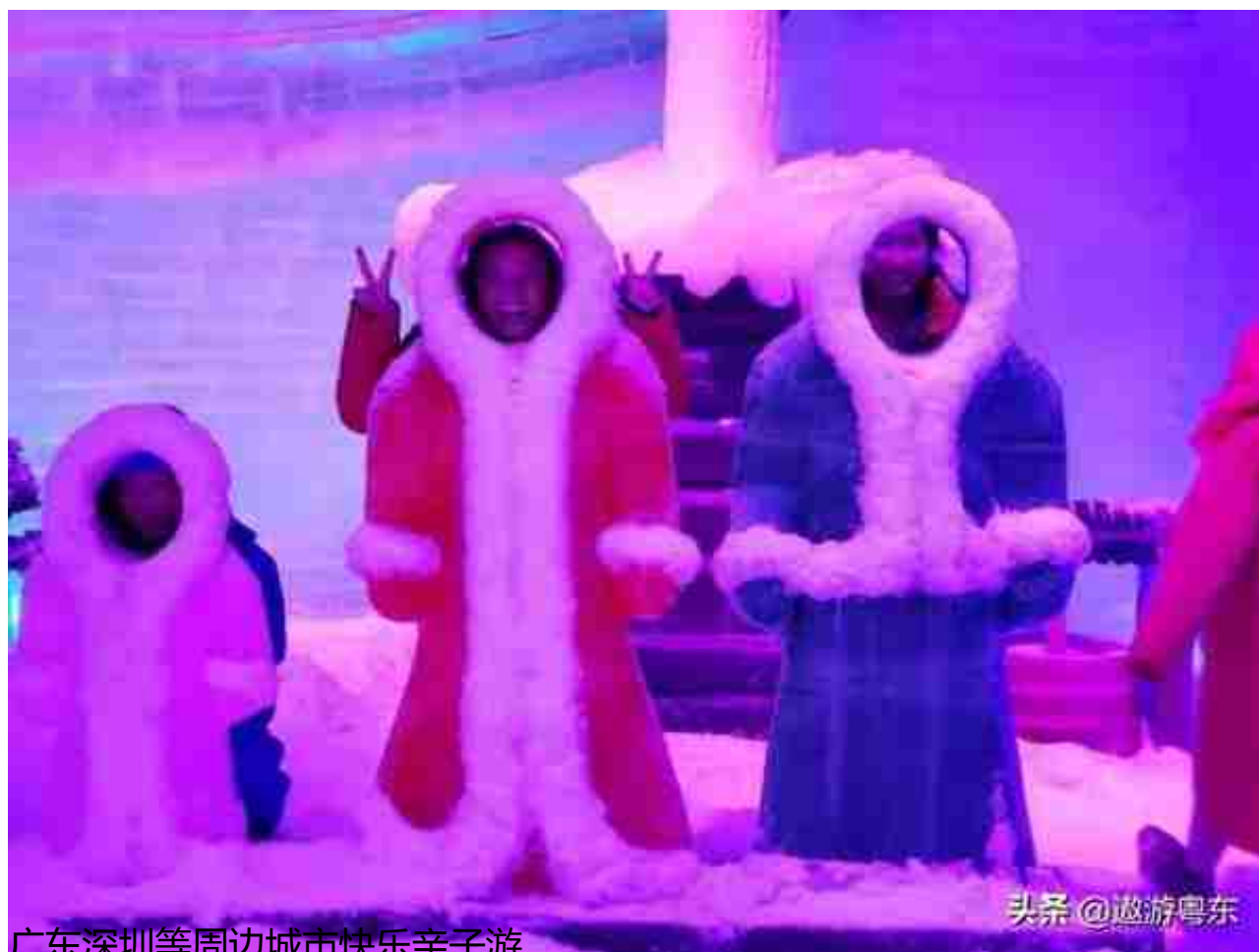
广东深圳等周边城市快乐亲子游

又有青山绿水，又有飞禽走兽，还有大小朋友脸上灿烂的笑脸，你还在犹豫什么呢??快快盘起来，来深圳野生动物园体验体验吧!