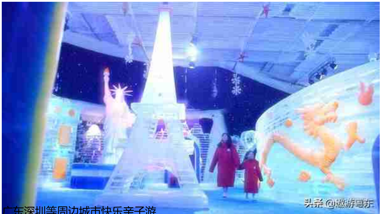
广东深圳等周边城市快乐亲子游