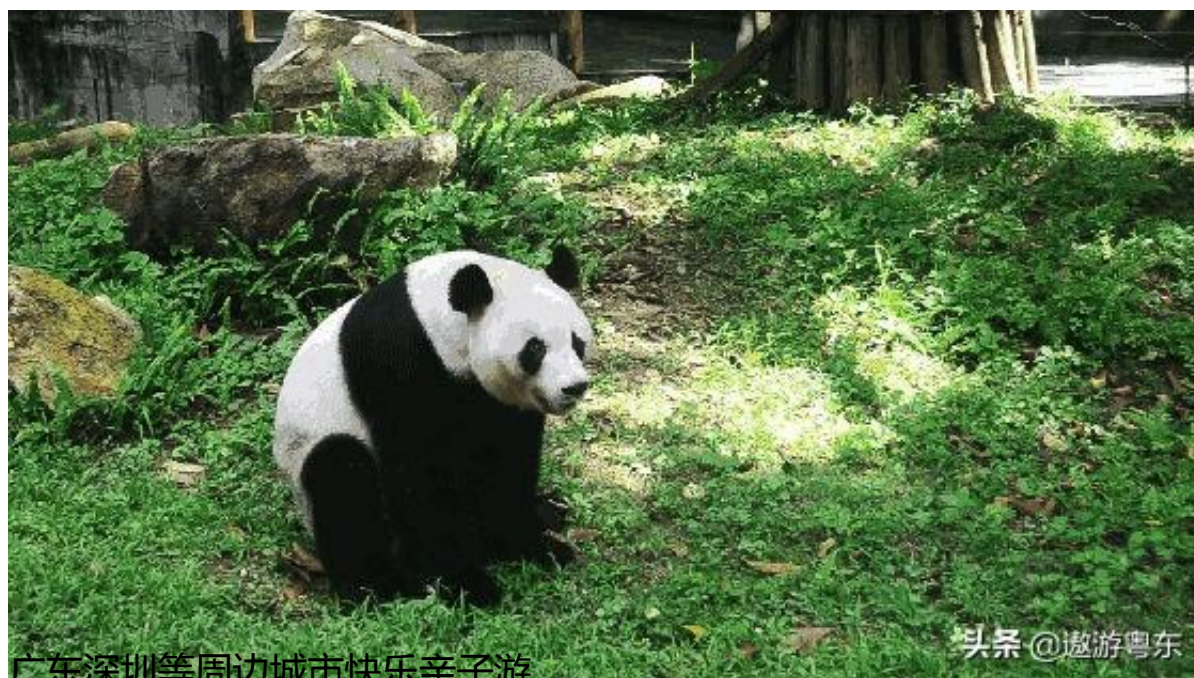
广东深圳等周边城市快乐亲子游

海豚作为全球各大水族馆的大明星，颜值高、性格好、技术棒，单是那流畅的身形，光滑的皮肤，小巧的嘴巴，漂亮的尾鳍就很吸引人