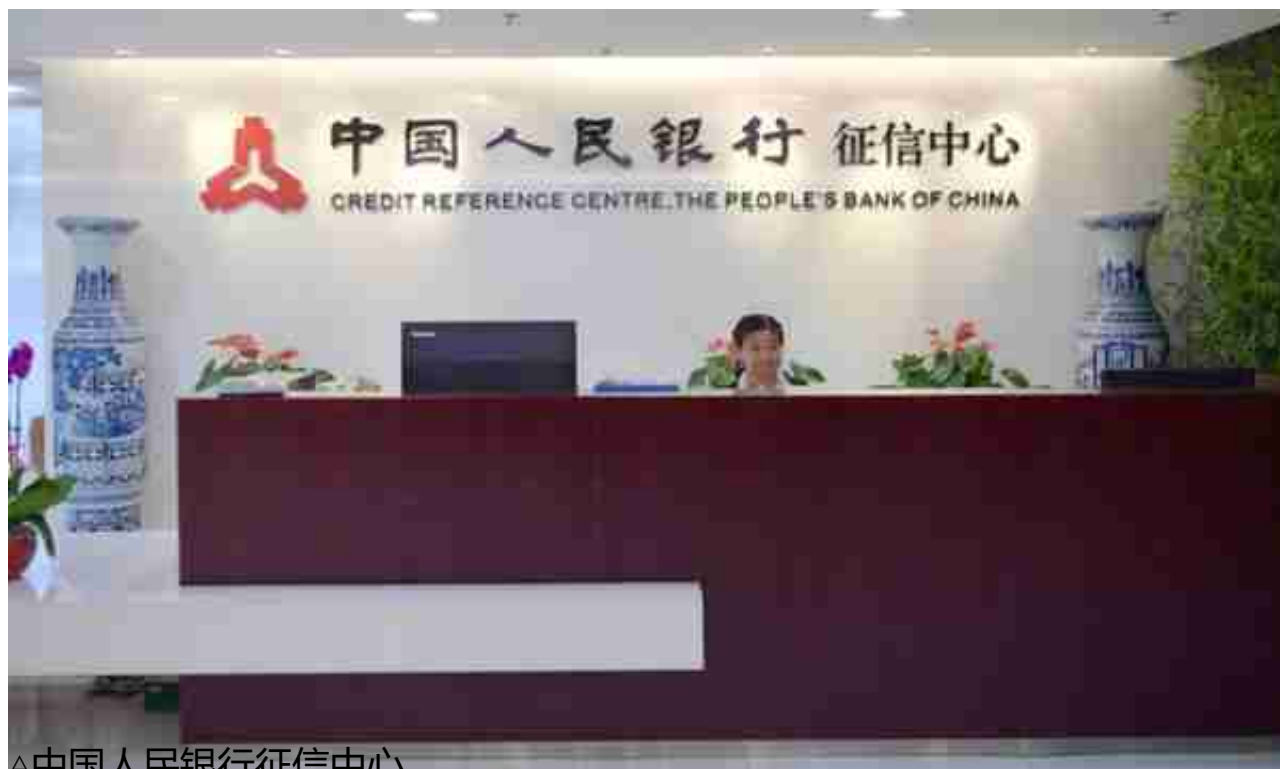
△中国人民银行征信中心