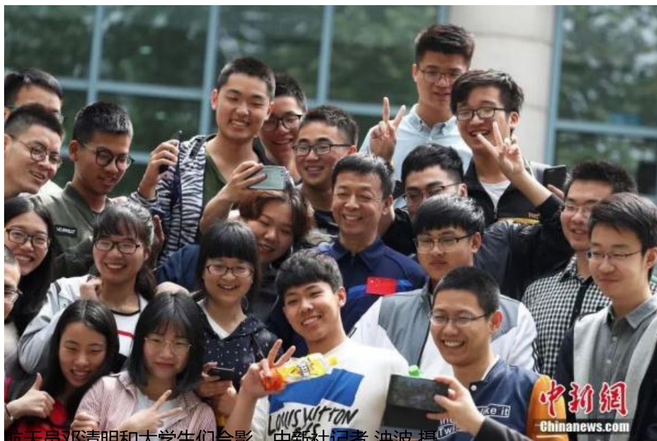
航天员邓清明和大学生们合影。

2010年，他入选成为神舟九号飞行任务备份航天员，遗憾落选后，他在地面按照手册，跟天上的航天员一起把所有程序都走了一遍，做到哪一步就打一个勾。