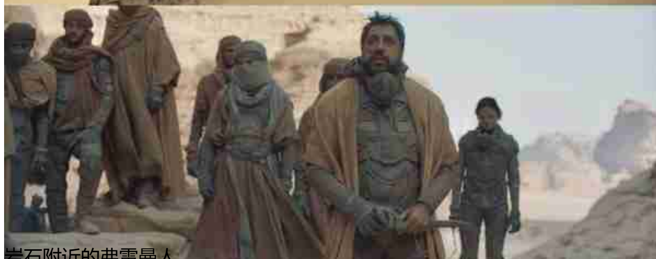
岩石附近的弗雷曼人