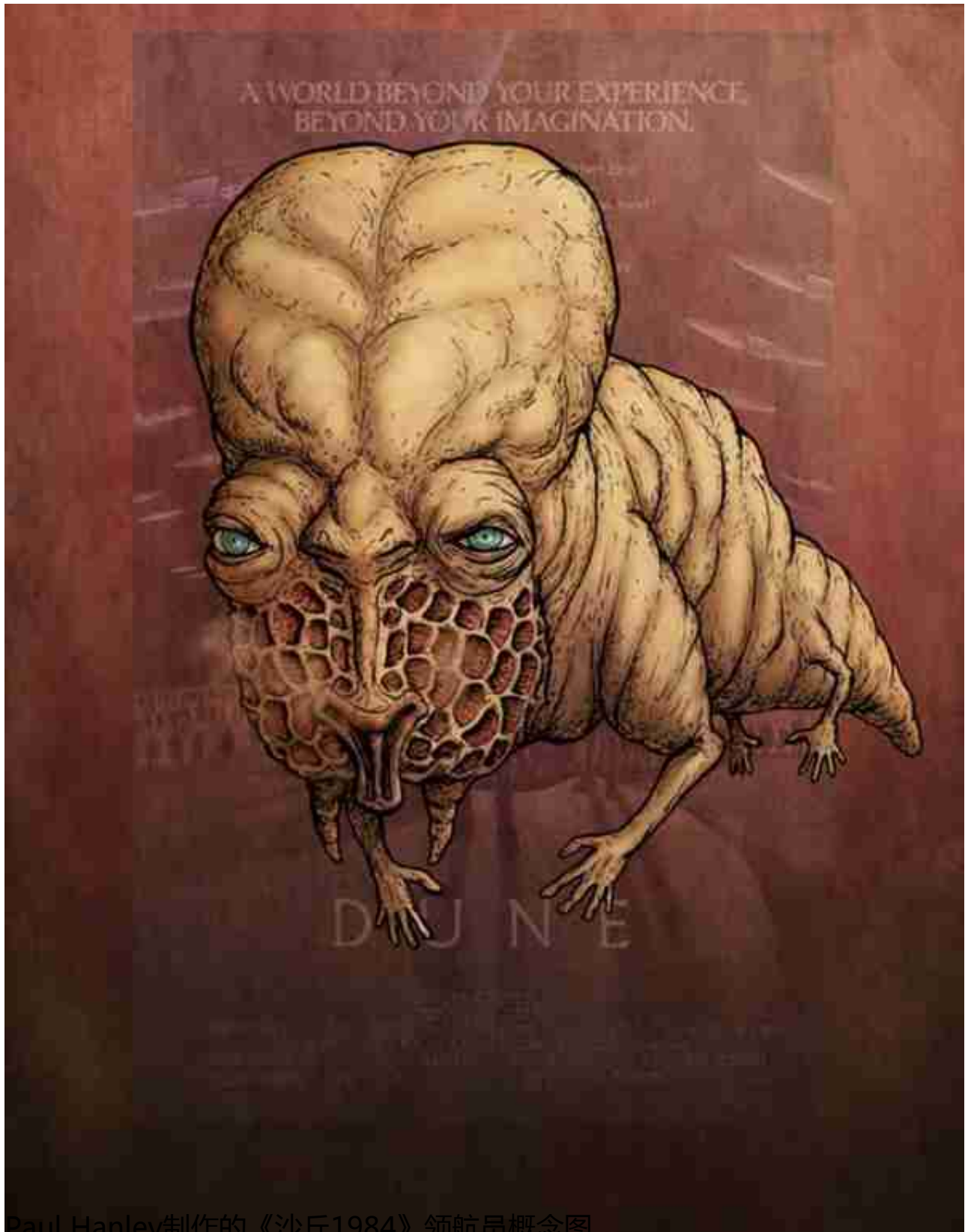
Paul Hanley制作的《沙丘1984》领航员概念图