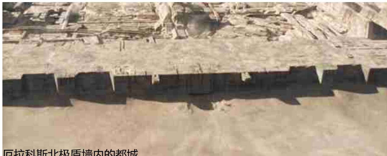
厄拉科斯北极盾墙内的都城