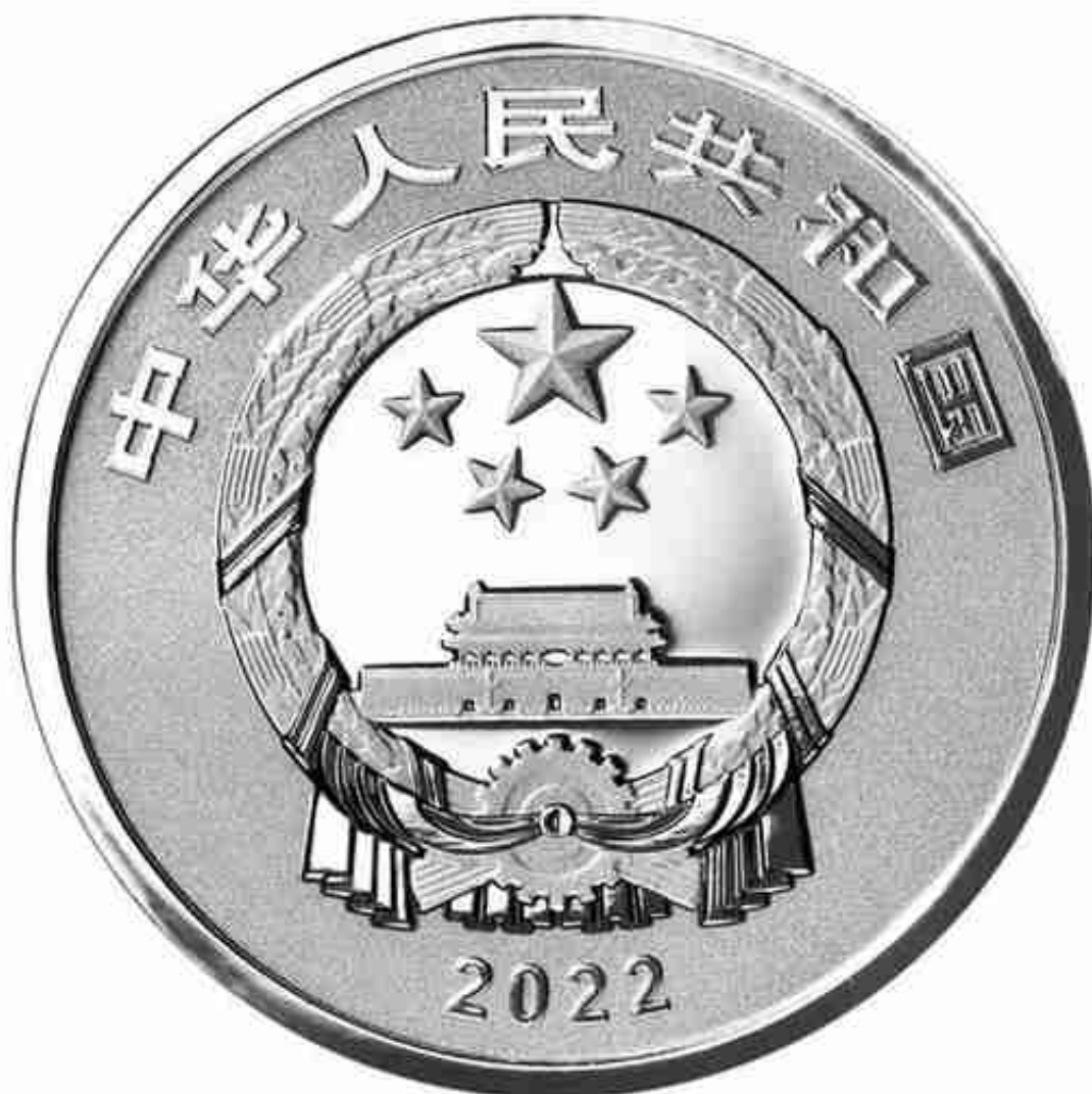
8克圆形普制银质纪念币正面图案