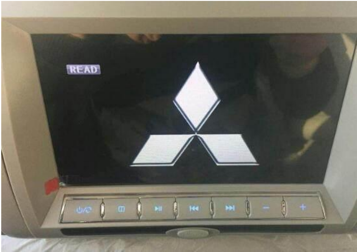
头枕DVD，有USB接口和SD卡槽